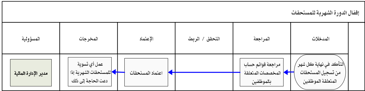
شكل رقم / ٥

يوضح المخطط البياني التالي ( شكل رقم/٥ ) طريقة تسلسل العمل لإقفال الدورة الشهرية للمستحقات: